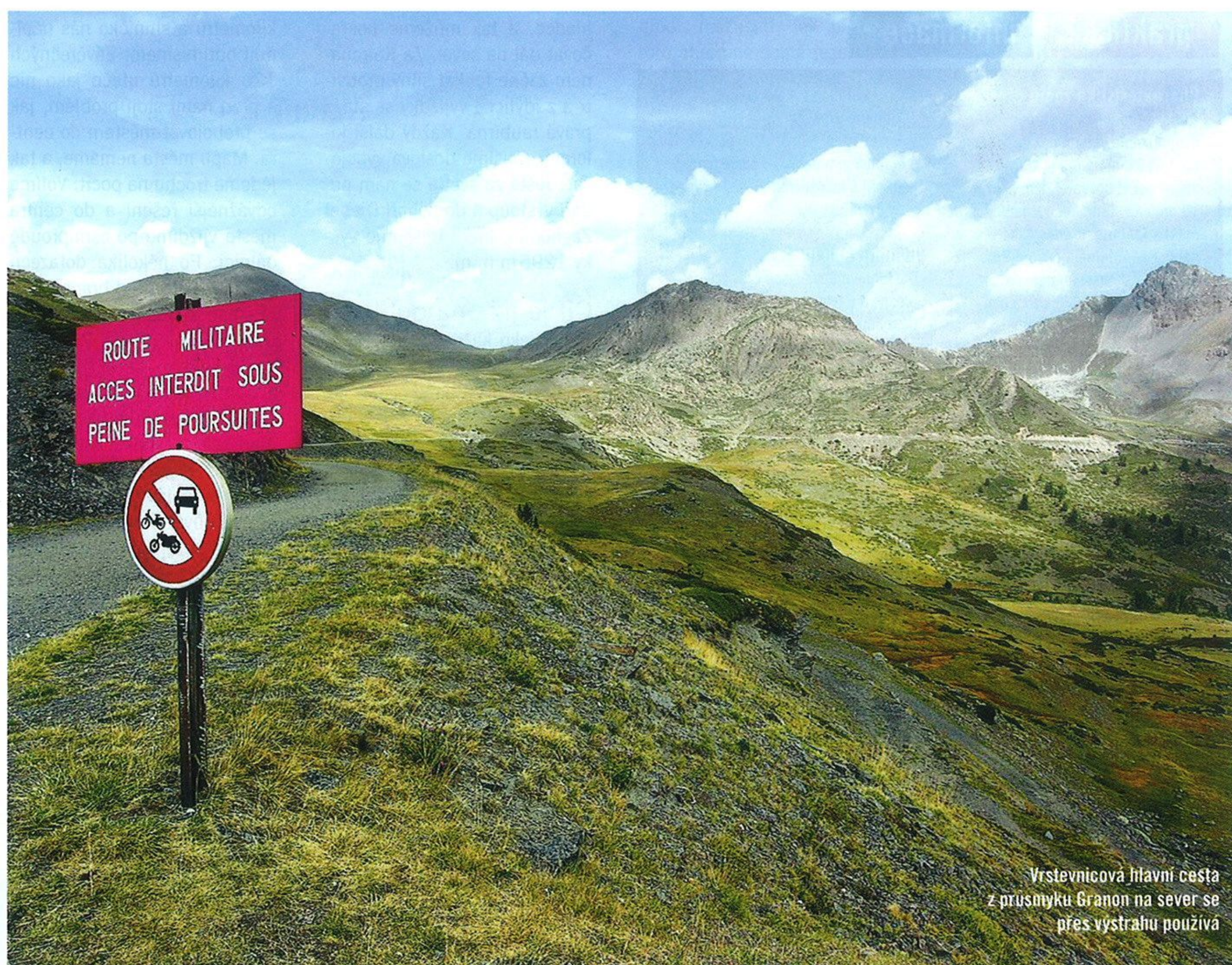
Vrstevnicová hlavní cesta z průsmyku Granon na sever se přes výstrahu používá