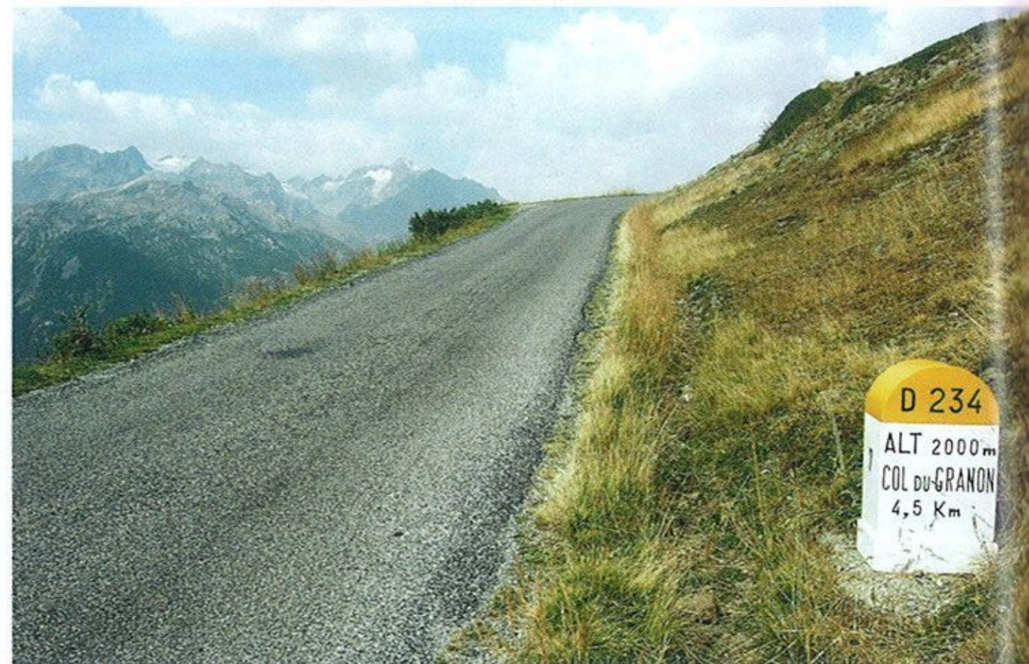
Silnice do nebe aneb jak se jezdí na Granon, v pozadí horské pásmo Lautaret – Galibier

opouštíme i my. A po pár set metrech vjíždíme na vrcholové plato. Už v úvodu jsem zmínil, že Granon je netypickým průsmykem. To plato je jedním z důvodů. Velikánská rovná plocha je využívána jako parkoviště pro osobní auta pěších turistů. Ti mají ještě k dispozici horskou hospodu – malý domeček s teráskou stojící vlevo nad parkovištěm. Opravdu domeček, horskou chatou nebo boudou bych se to bál nazvat.