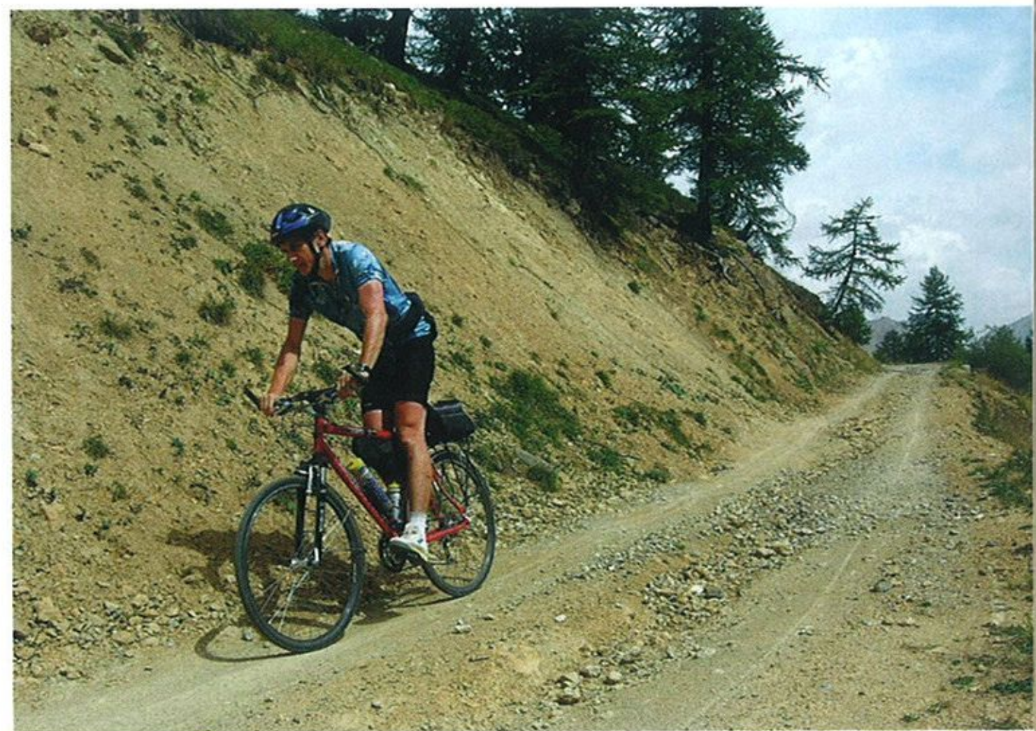
Bývalá kasárna na jižním svahu těsně pod vrcholovým platem. Vojenské cesty tu jsou většinou ve výborném stavu, i sjezd na krosovém kole je radost.

a vydával se na různé túry. Pochopitelně autem a pěšky. Mrzlo, až praštělo, silnice byly suché. Granon jsem si vytipoval proto, že sněhu bylo všude málo a jižní svahy byly dokonce většinou úplně holé. Vypadalo to, že mám šanci se hezky projít, a tak poznat sedlo jinak než obvykle. Ale to se nepovedlo. Silnice byla prakticky hned za Villardem zavřená. A taky docela zamrzlá. Mimo ni však led ani sníh skoro nebyl. Při přemítání co dál mi kousek před vozem líným krokem přešla liška. Nevěřicně jsem zíral, ale rozhodl se vyrazit. Často se dalo jít kratší turistickou trasou. Na ní se mi zase poštěstilo vyrušit tři mladá divoká prasata. Tak takhle to tady chodí v zimě! Člověka jsem nepotkal žádného. Naštěstí ani bachyni... Procházka to byla pěkná, došel jsem docela vysoko, prakticky až na pláně, kde končí les. Tam mě otočil nárazový ledový vítr, tak silný, že mi doslova rval hůlky z rukou. Sundat rukavice a pořídít fotku bylo za těchto podmínek hrdinským činem.